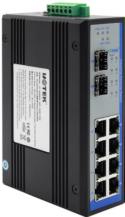
UT-60208G-8GT-2XGP-POE 8G+2XG万兆非网管型POE以太网交换机